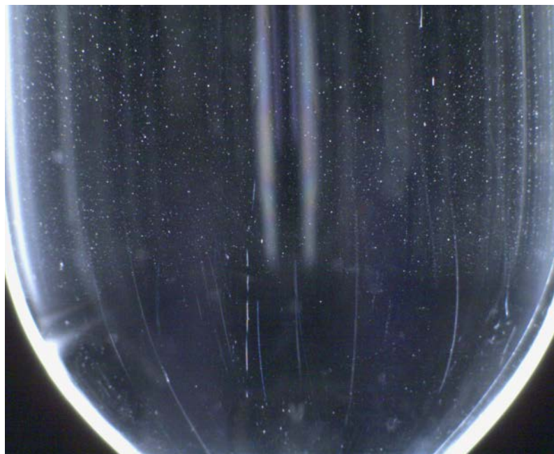
Aufnahmen von Ballonkathetern ohne (links) und mit (rechts) Defekt.

an der ZHAW ein System zur vollautomatischen optischen Qualitätskontrolle von kardialen Ballonkathetern entwickelt. Die manuelle visuelle Kontrolle der Katheter auf Produktionsmängel wie Kratzer, Materialeinschlüsse oder Blasen ist sehr aufwändig, bei gleichzeitigen sehr hohen Qualitätsanforderungen: Die Erkennungsrate von defekten Kathetern muss Nahe an Eins liegen, während der Anteil von aussortierten, aber nicht defekten Exemplaren («false positive rate») nicht zu hoch sein darf.